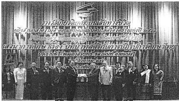
สนับสนุนทุนกองทุนการศึกษามูลนิธิรัฐบุรุษพลเอกเปรม ติณสูลานนท์ ประจำปี ๒๕๖๒ จำนวนเงิน ๔๓๘,๐๐๐ บาท