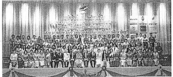
สตรีตัวอย่างแห่งปี ๒๕๖๑